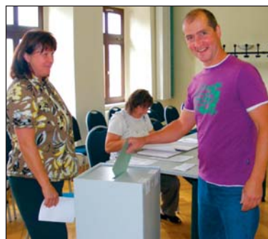
(oben) Wahllokal Raußlitz (links) Wahllokal Raußlitz bei der Auszählung der Stimmen