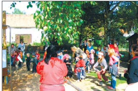
Anschließend wurde das Schiff „Greta“ mit Wasserbomben getauft Weitere Fotos auf Seite 10.