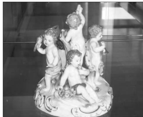
Figurengruppe „Die Sinne“

Wir wurden in Gruppen aufgeteilt. In der ersten Gruppe haben wir erfahren, was man zur Herstellung für das Porzellan braucht. Die zweite Gruppe hat sich als erstes den Film über die Porzellanherstellung und die Entstehung der Schwerter angesehen. Dann haben die Gruppen getauscht. Wir haben mit der Besichtigung im Porzellanmuseum angefangen. Am besten haben uns die Safari und die Eiswelt gefallen. Nach der Führung durften sich alle etwas Schönes kaufen. Dann ging es wieder nach Hause.